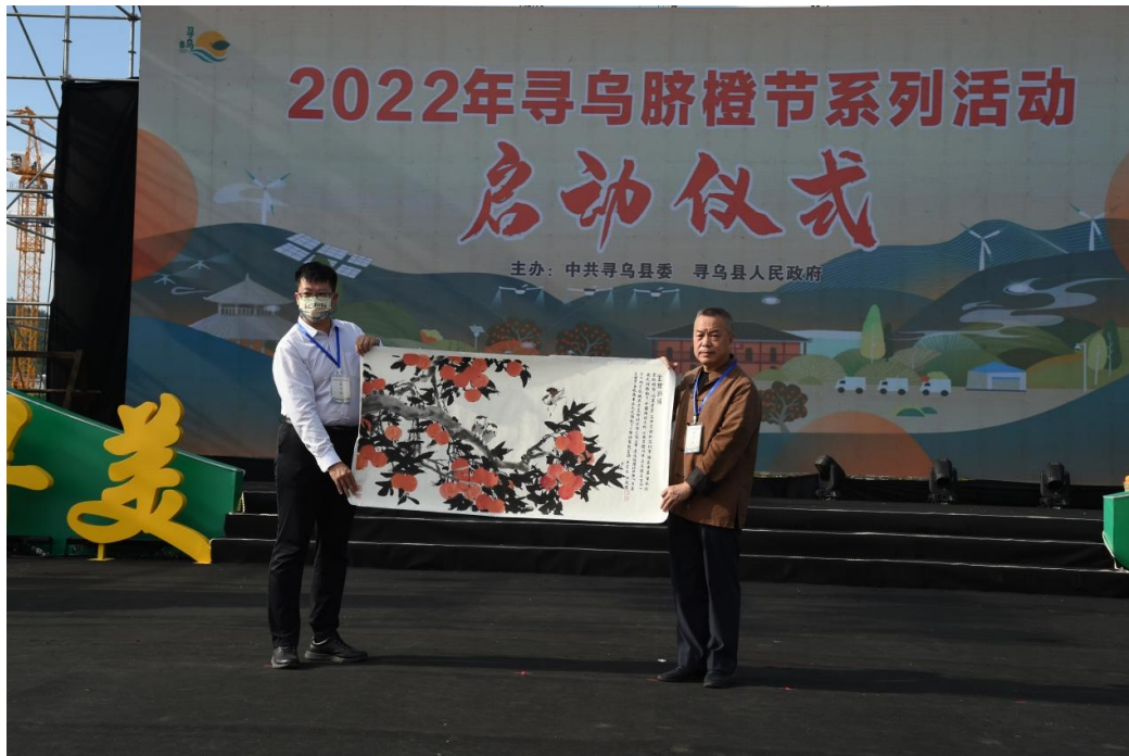
图：2022 寻乌脐橙节系列活动启动仪式中现场

此外，华林证券乡村振兴发展基金还首次将目光投向了“城市建设者”以及他们的家人，通过“美好社区共创行动”，以社区为载体，以艺术为桥梁，打造“华林关爱包”，为有不同需求的城市弱势群体带去关怀和安慰，提升城中村人居品质，推动物质生活和精神生活共同富裕。同时，华林证券积极发挥券商行业特色，开展投资者教育进社区活动，通过系列专题讲座、答题、调研等喜闻乐见的投教活动，传授金融常识、传播风险意识，推动投资者普及教育与普惠金融的有机结合，引导社区居民树立理性投资观念，加强风险防范，保护中小投资者合法权益。