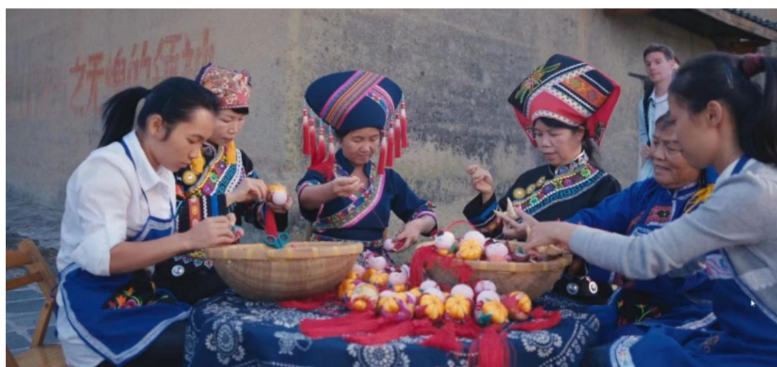
图：广西上林“渡河公”制作现场