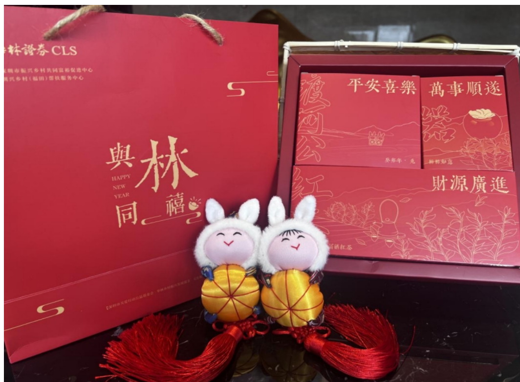
图：华林证券乡村振兴文化共创行动之上林渡河公新春礼盒

乡村少年等。2022年末，公司启动了乡村振兴文化共创行动，以广西上林的非物质文化遗产“渡河公”为载体，融入新春佳节美好祝福和全新的文创产品设计理念，使传统文化焕发新颜，在传承非遗根脉之余，激活当地文化资源，以文化共创助力乡村振兴，为促进精神文明建设，构建中国式社会主义和谐社会贡献华林力量。同时，该行动为当地妇女和下岗职工实现灵活就业，带动就业增收提供了重要支持。